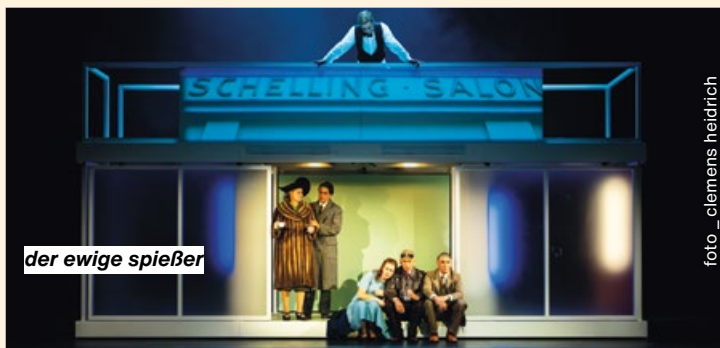
der ewige spieler