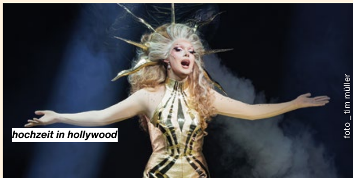
hochzeit in hollywood

Ende der 1990er, Lena und Tatjana haben ihre Heimat, die Ukraine, verlassen und versuchen neu anzufangen. Ihre Töchter Edi und Nina,