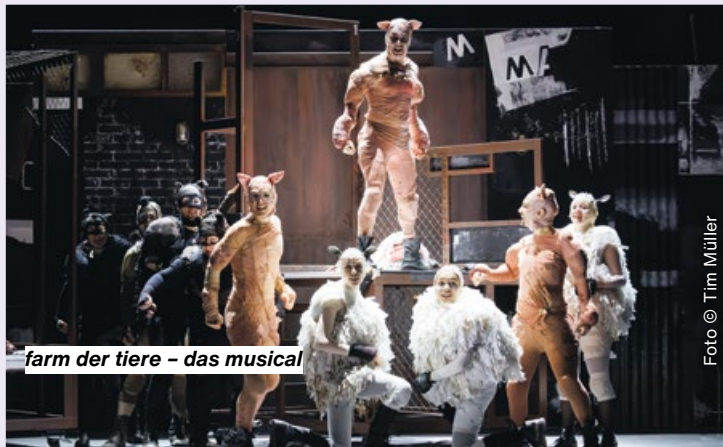
farm der tiere – das musical