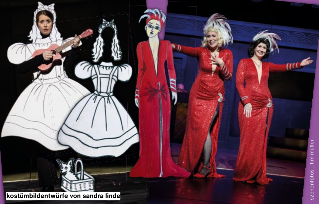
kostümbildentwürfe von sandra linde