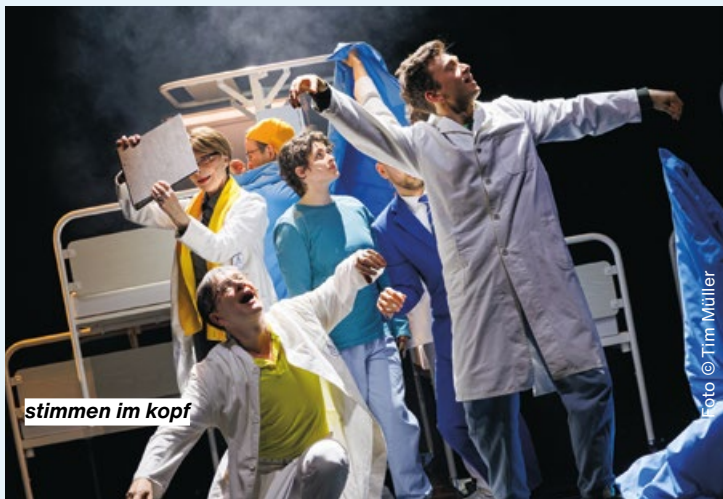
stimmen im kopf