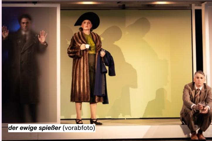
der ewige spießer (vorabfoto)